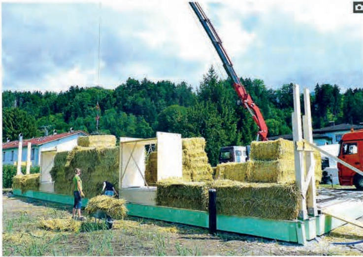
Die aufeinandergestapelten Strohballe tragen ... • The stacked up bales of straw ...

... selbst die hölzerne Dachkonstruktion. • ... even support the timber roof structure.