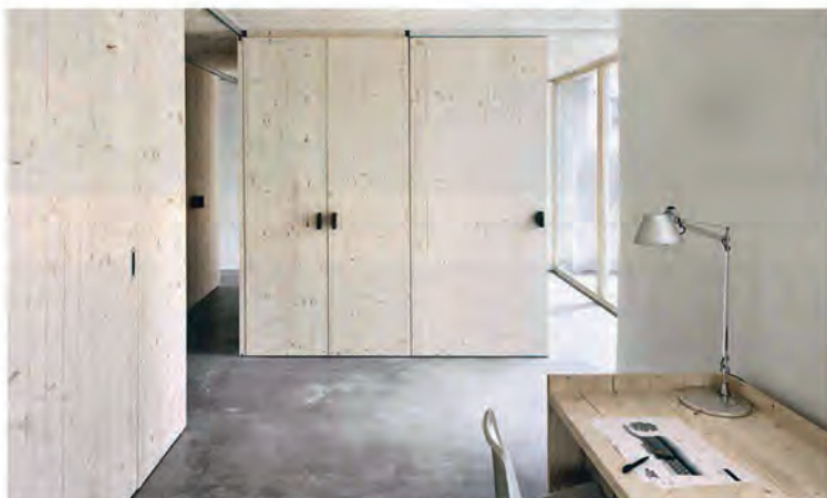
Mittels Schiebetüren lassen sich die Räume ganz nach Bedarf ... • The rooms can be connected or separated ...

Das Wohnhaus mit einer 120 Zentimeter dicken Außenhülle bietet im Inneren ein offenes Raumkonzept. In die „freie Halle aus Stroh“ haben wir vier Wohnboxen aus Holz eingestellt - Technik und Waschen, Werken, Schlafen 1 und Schlafen 2. Zwischen den verschiedenen Nutzungszonen entsteht ein fließender Übergang: Die Holzboxen können durch Schiebetüren geöffnet oder geschlossen werden. So entstehen Räume, die ganz nach Bedarf unterschiedlich konfiguriert werden können. Dadurch konnten wir auch das natürliche Licht optimal nutzen und gleichzeitig dem Wunsch nach Rückzug und Intimität beispielsweise im Bereich des Badezimmers entsprechen. Das Strohhaus bewährt sich in vielerlei Hinsicht. Optisch sind das zunächst sicherlich die wohlthuende Durchlässigkeit des Tageslichtes und die natürlichen Materialien, die das Haus und seine Bewohner atmen lassen. Für seine Holzbaukunst ist das österreichische Bundesland Vorarlberg bereits über seine Grenzen hinweg bekannt. Mit einem lastabtragenden Strohballenhaus konnten wir noch einen Schritt weiter in Richtung nachhaltiger und ökologischer Architektur gehen und vielleicht einen neuen Akzent setzen.