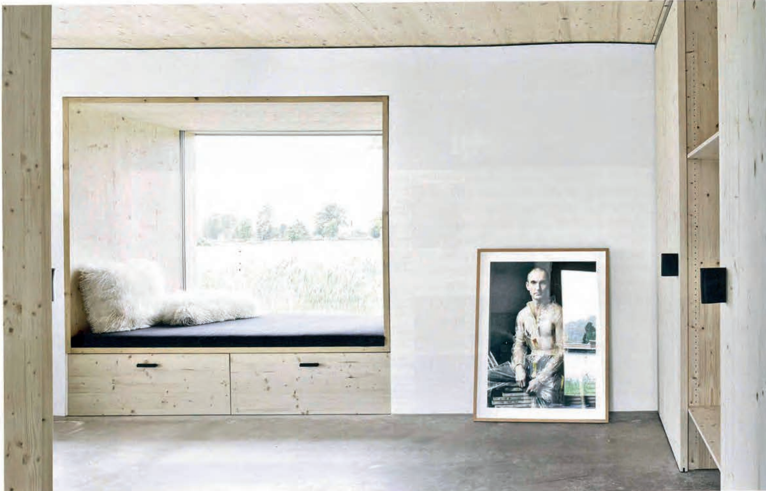
In den 120 Zentimeter tiefen Fensterlaibungen entstehen attraktive Aufenthaltsbereiche mit Blick in die Natur. • The 120-centimeter deep window reveals provide attractive sitting areas with a view into nature.

Neuer Ansatz für nachhaltige Architektur: Ein ökologisches Wohnhaus aus Strohballen in Vorarlberg von Georg Bechter New approach for sustainable architecture: ecologically sound house built of straw bales in Vorarlberg by Georg Bechter