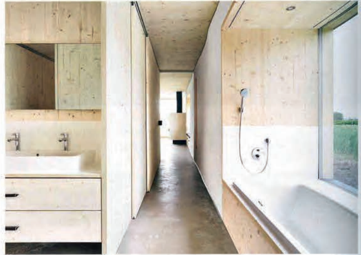
Holz, weiße Lehmwände und Estrich bilden den Materialkanon. • Wood, white clay walls and screed form

The private home in Dornbirn had not been planned as a straw building from the start, this solution developed out of the wish to construct ecologically sound and economic living space. The client liked the idea and so the decision was taken to implement a load-transferring straw house built of large bales. The wish for a barrier-free layout allowing the use of the house in old age suggested a single-storey building. It is located at the development line of an estate and forms a harmonious transition to the extensive reeds landscape. Straw is a quickly renewable resource and the only insulating material that does not require any treatment. The building process is relatively simple: the bales of straw are stacked up, subsequently, the material settles by about 15 centimetres and is then rendered with lime plaster on the outside and clay on the inside. The entire wall structure made of straw is compostable. The timber roof structure is also insulated with straw. The load-transferring straw walls do without a supporting timber structure.